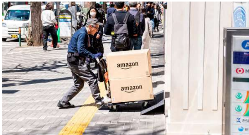
Repartidor de Amazon.

Hasta aproximadamente noviembre del 2020 las personas conductoras de DSP y Amazon Flex recibían una remuneración por paquete, cabe decir que el número de paquetes que se entregaban diariamente era limitado. Con el lanzamiento de la aplicación de reparto de Amazon llamada Rabbit, la remuneración de quienes conducen para DSP pasó a ser una tarifa fija diaria, independientemente del número de paquetes entregados. En el centro de reparto de Miharu, en Yokosuka, prefectura de Kanagawa, el operador de DSP (llamado Wakaba) explicó a quienes realizaban los repartos que el número de paquetes sería de entre 80 y 90 al día, con un máximo de 150 paquetes en algunas ocasiones. A partir de mayo del 2021 Amazon comenzó a utilizar inteligencia artificial para asignar el reparto de sus paquetes. Posteriormente el número de paquetes que cada persona debía entregar al día siguió aumentando, algunas personas conductoras tenían que entregar más de 200 paquetes al día. Amazon indicó a sus DSP que limitaran las horas de trabajo diarias de las personas conductoras a 60 horas semanales, lo cual supone una jornada laboral de 12 horas en una semana laboral de 5 días. Para entregar 200 paquetes en 12 horas, quienes realizan los repartos deben entregar 1 paquete cada 3 minutos y 36 segundos. El número excesivo de