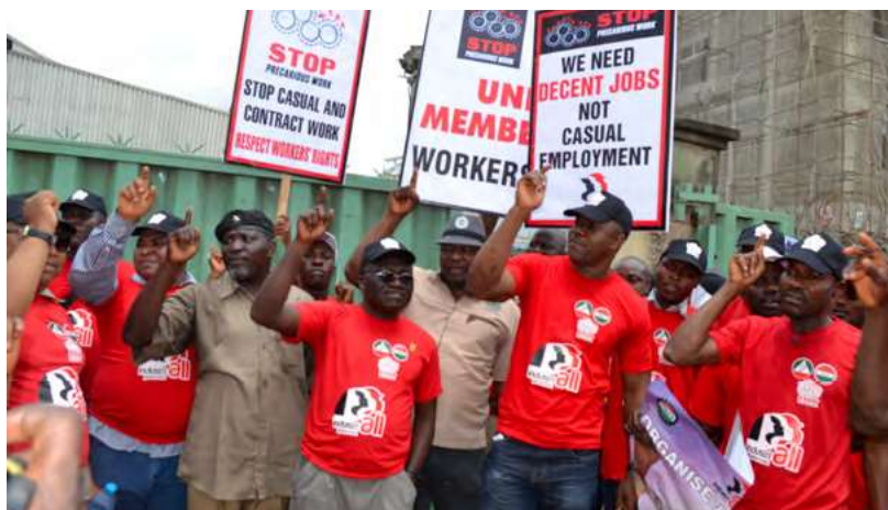
Manifestación por el trabajo digno, Nigeria.

sindicatos para identificar las estructuras de empleo que amenazan el crecimiento sindical. Durante mi mandato como vicesecretaria general (Relaciones laborales), la delegación se reunió con el Ministerio de Trabajo entre 2020 y 2023. Estas reuniones culminaron en un documento de posición en el que se abogaba por una revisión de las directrices relativas a la contratación de personal y la subcontratación en el sector del petróleo y el gas. 16