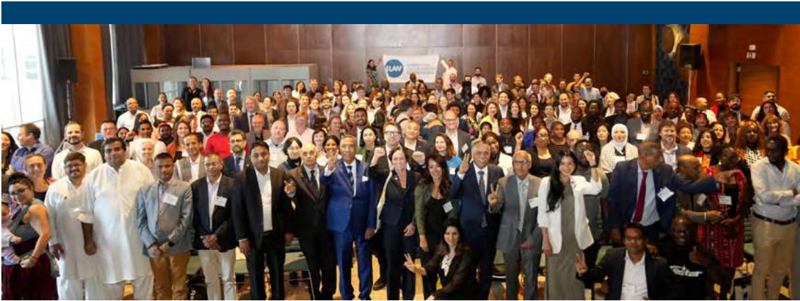
Conferencia de la ILAW en Casablanca, Marruecos.