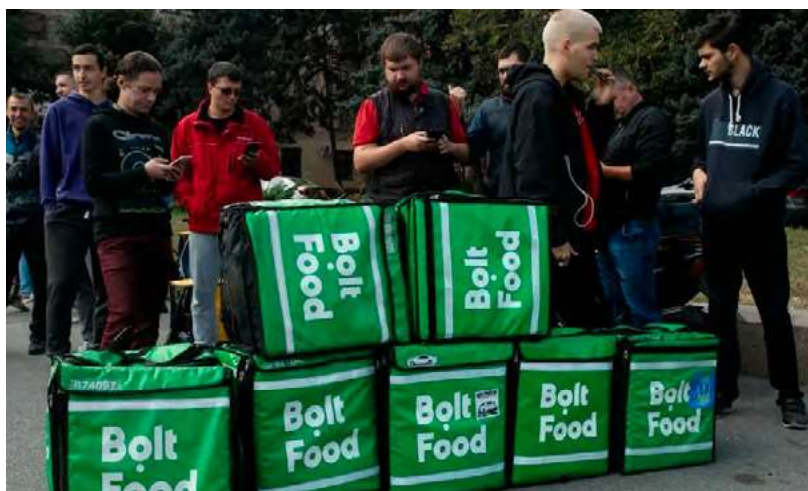
Los repartidores de comida de Bolt, que trabajan a través de la aplicación Dipro, organizaron una manifestación para reclamar un aumento salarial.

de la sociedad civil y sindicatos tradicionales. Además de crear conciencia, Labor Initiatives organizó talleres con personas trabajadoras de plataformas y periodistas asociadas para desarrollar estrategias de organización y planes de comunicación para la educación pública sobre cuestiones relacionadas con el trabajo en plataformas en los medios de comunicación nacionales y en sus propias redes sociales. LI también conectó a personas trabajadoras de plataformas de diferentes países para compartir experiencias, mejores prácticas y analizar los esfuerzos de sindicalización en el extranjero.