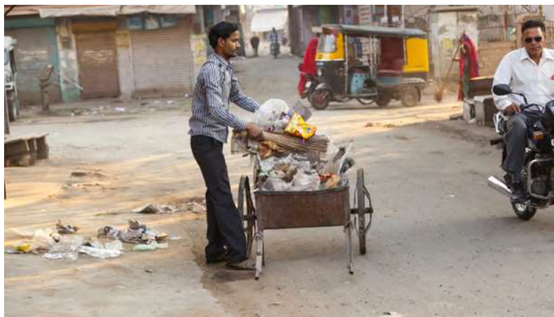
Barredor de calles informal.