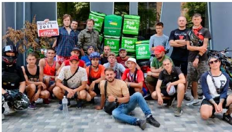
Manifestación de repartidores de Bolt Food en Kiev: un grupo de repartidores de Bolt Food, reunidos cerca de las oficinas de la empresa en Kiev, reclaman un aumento de sus ingresos, ya que los precios se han disparado en Ucrania.

organización sin ánimo de lucro. Su objetivo era generar conciencia sobre los retos en derechos laborales a los que se enfrentan las personas trabajadoras del sector del cuidado en Ucrania y apoyar los esfuerzos del país para formalizar el trabajo doméstico a través de la legislación. Para fomentar la productividad y un sentimiento de comunidad entre las personas cuidadoras de infancias, LI dispuso de su oficina como un espacio para reuniones de equipo, interacciones entre personas trabajadoras y sesiones de formación para quienes trabajan en el cuidado de infancias y activistas. La asesoría legal frente a formas de representación para personas trabajadoras y el apoyo en la difusión mediática, provisto por personas abogadas de LI y del Solidarity Center en Ucrania, llevó a que en julio de 2019 se creara la ONG United Home Staff (UHS, por sus siglas en inglés) 8 que eventualmente se transformó en un centro comunitario y de información al servicio de sus 1.800 miembros en redes sociales.