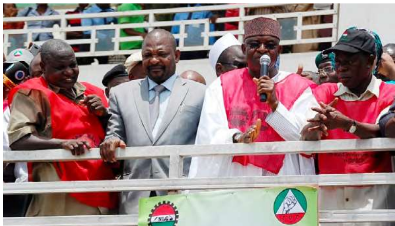
Manifestación en Nigeria.

nacionales, sino que se traduzca en acciones para promover y defender los derechos existentes.