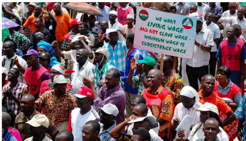
Manifestación en Nigeria.

sindicato deben disfrutar del derecho a la oposición: se debe tolerar la actividad de las facciones. Los miembros deben disfrutar del derecho a celebrar reuniones fuera de las reuniones oficiales del sindicato sin recibir ataques. Las tendencias así formadas en el sindicato deben ser libres de desarrollar políticas alternativas y presentar listas de candidaturas en las elecciones basadas en programas y políticas.