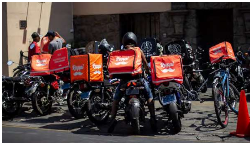
Muchos repartidores de Rappi esperando fuera de un restaurante.

una recomendación. 13 Las personas abogadas sindicales han apoyado esta campaña de diversas maneras: han preparado y redactado informes jurídicos sobre el marco normativo en diferentes contextos nacionales y regionales, y han documentado casos emblemáticos en los que las decisiones judiciales permitieron a las personas trabajadoras de plataformas formar o afiliarse a sindicatos y ejercer su derecho a la negociación colectiva. 14 Al convertir los precedentes jurídicos en herramientas de movilización, las personas abogadas ayudan a los sindicatos a aumentar su número de miembros y a amplificar su voz.