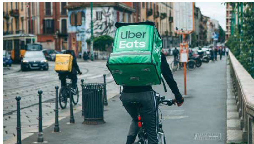
Repartidor de Uber Eats.

La tercera pregunta del referéndum buscaba modificar la legislación que regulaba los contratos laborales a término fijo. En el momento de la propuesta, los contratos a término fijo tenían una periodicidad máxima predeterminada de 24 meses y, si se daban por terminados en cualquier momento después del primer año de vigencia, la persona empleadora debía presentar una justificación. 23 Esta disposición tiene como objeto crear más seguridad para las personas trabajadoras con contrato y temporales, quienes