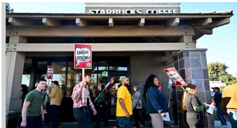
Huelga de los trabajadores de Starbucks.

salariales discriminatorios de la empresa que favorecen a las tiendas no sindicalizadas y, más recientemente, por un código de vestimenta obligatorio que viola los derechos de las personas trabajadoras a llevar insignias sindicales en el lugar de trabajo. Las decisiones de la junta han creado numerosas prohibiciones específicas a las que Starbucks Workers United ha prestado mucha atención. La resultante capacidad de las personas trabajadoras para responder con huelgas por prácticas laborales injustas finalmente llevó al empleador a la mesa de negociaciones, pero también ha cambiado fundamentalmente la forma en que el público percibe la marca Starbucks. Con cada huelga por prácticas laborales injustas, en la que las personas trabajadoras refuerzan su derecho a denunciar las violaciones de la legislación laboral y a volver al trabajo, el público en general ve a un empleador que incumple repetidamente la ley.