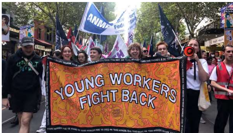
Centro de Jóvenes Trabajadores, con sede en el Trades Hall de Victoria.

Los módulos impartidos por el Young Workers Centre a estudiantes de secundaria y de los TAFE han tenido una acogida abrumadoramente positiva. Se realiza una encuesta a las personas estudiantes antes y después del módulo para determinar la eficacia de la sesión y se observa una mejora significativa en sus conocimientos sobre el lugar de trabajo. En 2024, el 81% de las personas profesoras de secundaria otorgaron al programa de divulgación una puntuación de 5 sobre 5 (la máxima calificación) cuando se les preguntó si recomendarían el programa a otras personas educadoras. El 19% restante otorgó al programa una puntuación de 4 sobre 5.