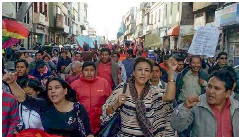
Manifestación en Ecuador.

Defendemos una lectura del derecho como campo de confrontación –tomando la expresión de Pierre Bourdieu–: un espacio donde se disputan significados, donde la norma se estira o se encoge según la fuerza de quienes la invocan. Tal concepción busca trascender la fórmula de "uso alternativo" y abraza la noción de contra-hegemonía jurídica :