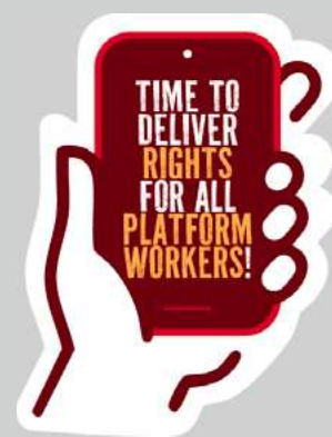
Campaña de la CSI en favor de los trabajadores de plataformas.

que la empresa colombiana restableciera su sistema de asignación de pedidos, aumentara la tarifa por pedido y dejara de penalizar a las personas repartidoras. El sindicato trabajó con un equipo legal que le asesoró para lograr el reconocimiento. 9