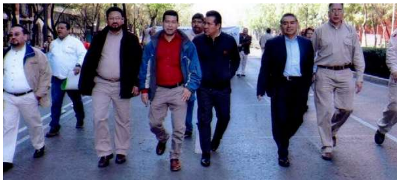
Manifestación en Ciudad de México de trabajadores petroleros que reclaman el reconocimiento del sindicato independiente, surgido a raíz de la reforma laboral de 2019.

En esta etapa se deberá realizar del trabajo tendiente la elaboración de un proyecto de contrato colectivo de trabajo que cumpla con la normativa aplicable y que responda a las necesidades y aspiraciones de las personas trabajadoras de acuerdo con la materia de trabajo que desempeñen.