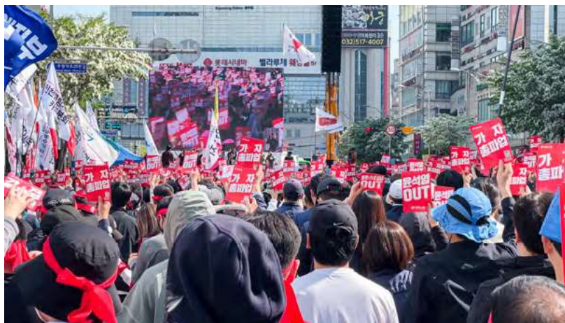
Manifestación de trabajadores con motivo del Día del Trabajo, Incheon, Corea del Sur.

12 Ministerio del Empleo y el Trabajo, Survey on Labor Conditions by Employment type , disponible en https://moel.go.kr/english/resources/survey.do . (última visita agosto 19, 2025).