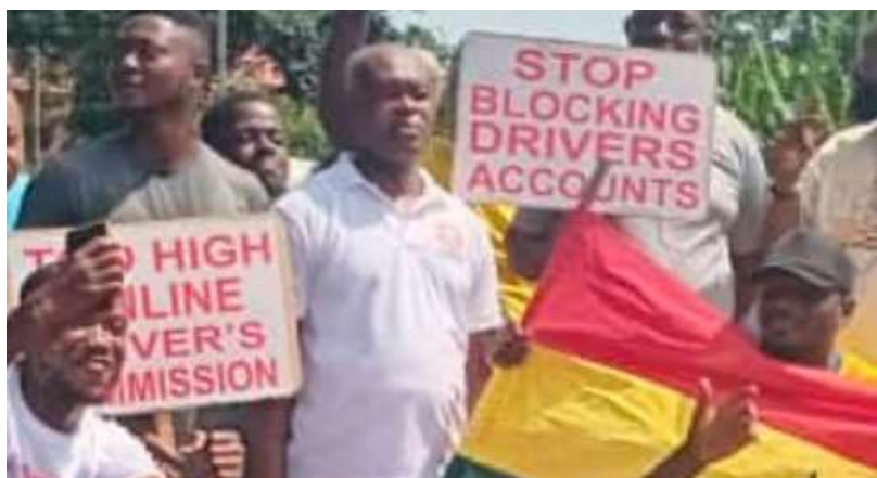
Manifestación del Primero de Mayo en Ghana.

Trabajé para UNICOF entre 2004 y 2013, ocupándome durante ese periodo de las